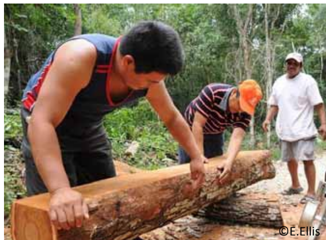
Miembros de una empresa forestal comunitaria en Quintana Roo, México se procesa un tronco para agregar valor y facilitar su transporte.